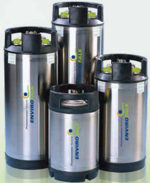
Kompakte Wasseraufbereitungsanlagen für Standardanwendungen.